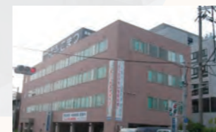
クリニックこまつ