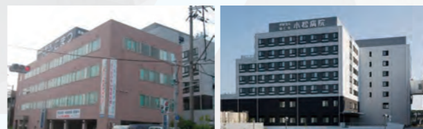
クリニックこまつ